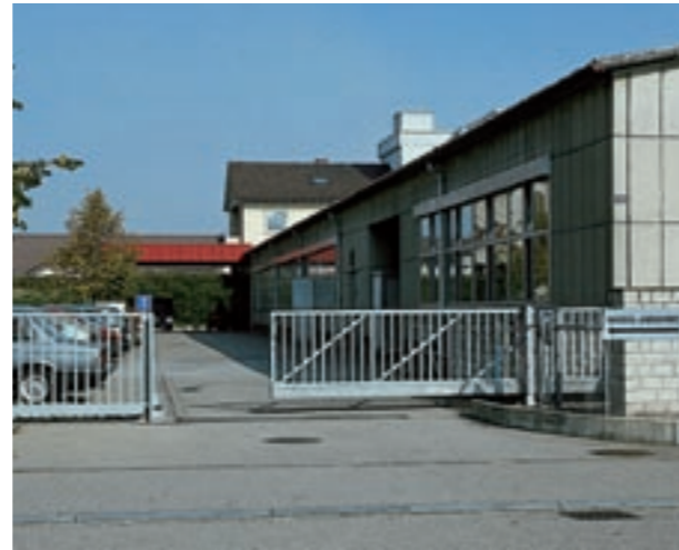
Härterei Wiederkehr, Urdorf