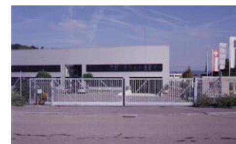
Stihl, Mönchaltorf (Doppel-Konsolschiebetor)