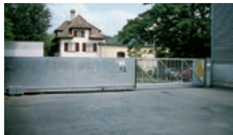
Werkhof, Rüti/ZH (Teleskoptor) → Geschäftshaus Förrlibuck, Zürich →