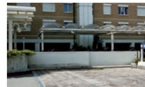
Mercedes, Schlieren (Teleskoptor)

gedruckt in der Schweiz - Konstruktionsänderungen vorbehalten.