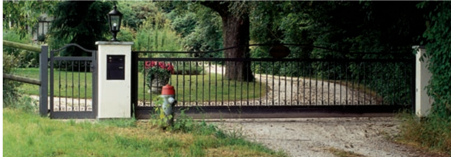
Landhaus, Horgen (freitragendes Schiebetor mit Servicetüre)